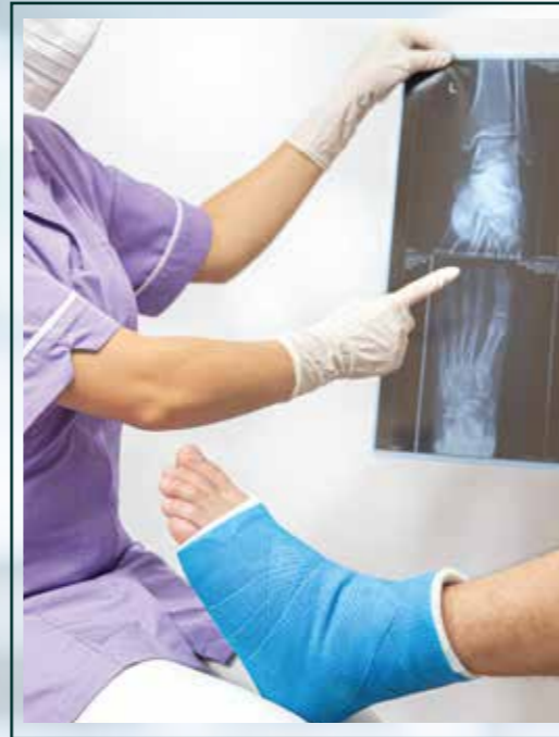
Ortopedia y traumatología