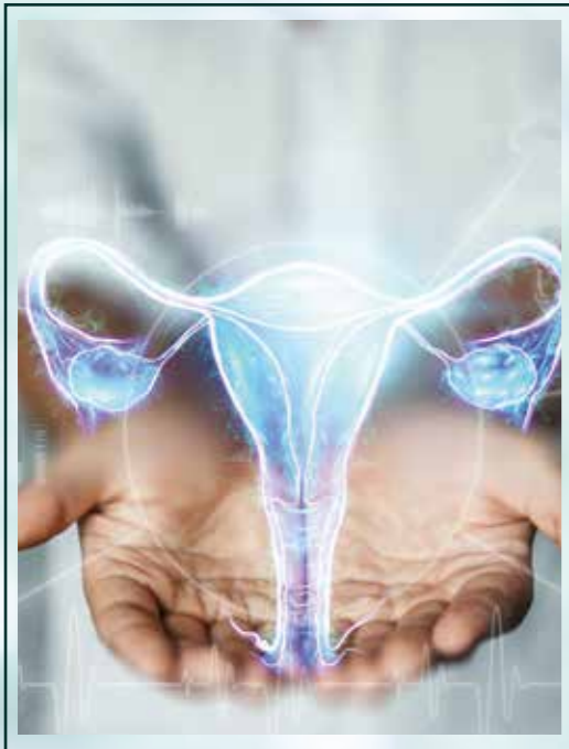
Ginecología y Obstetricia