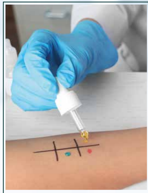
Inmunología y Alergología