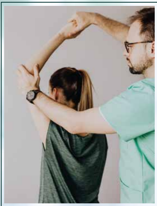
Fisiatría-Medicina física Rehabilitación